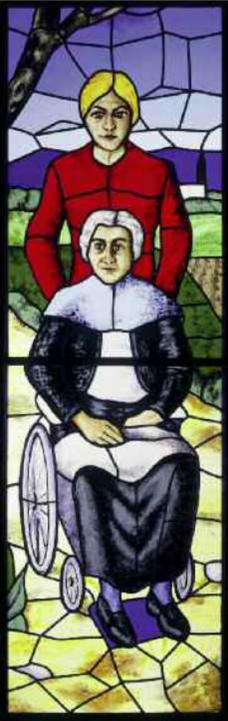
Stipido Bumbini: "Visitare gli inferni", vetrata - Chiesa dell'Immacolata, Padova