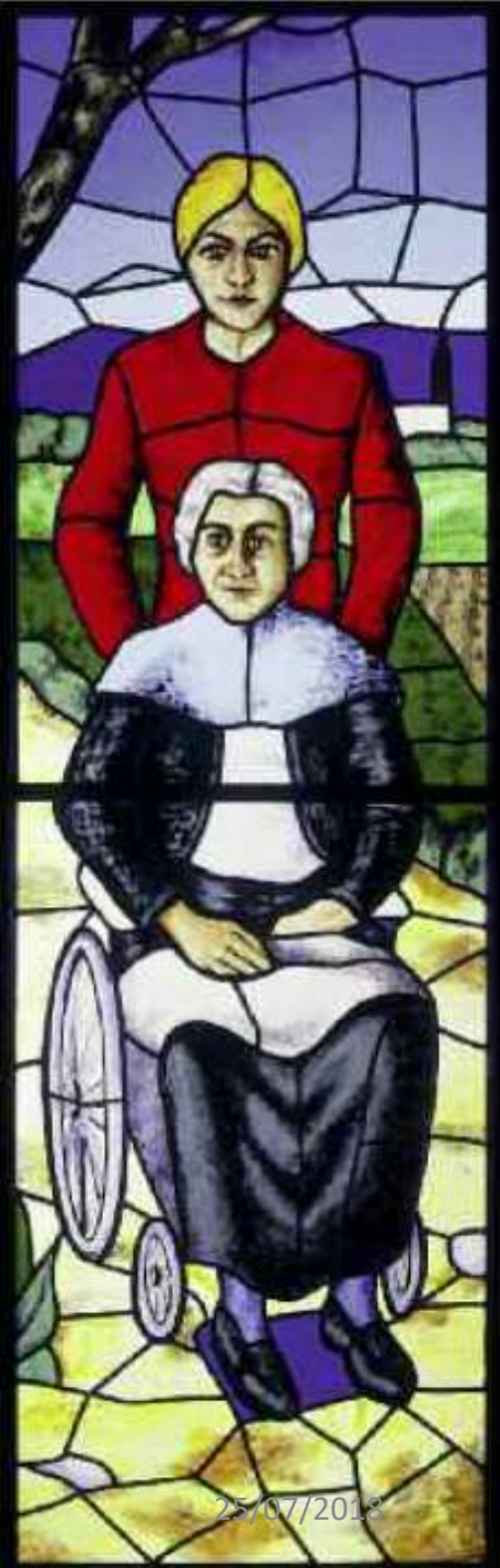
Stipakso, Humalag: "Visitare gli infermi", vetrata - Chiesa dell'Immacolata, Padova